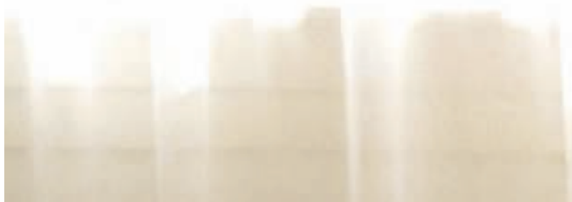
De voorstelling Bimbo verbeeldt de opmars van de bimbo: normale meisjes